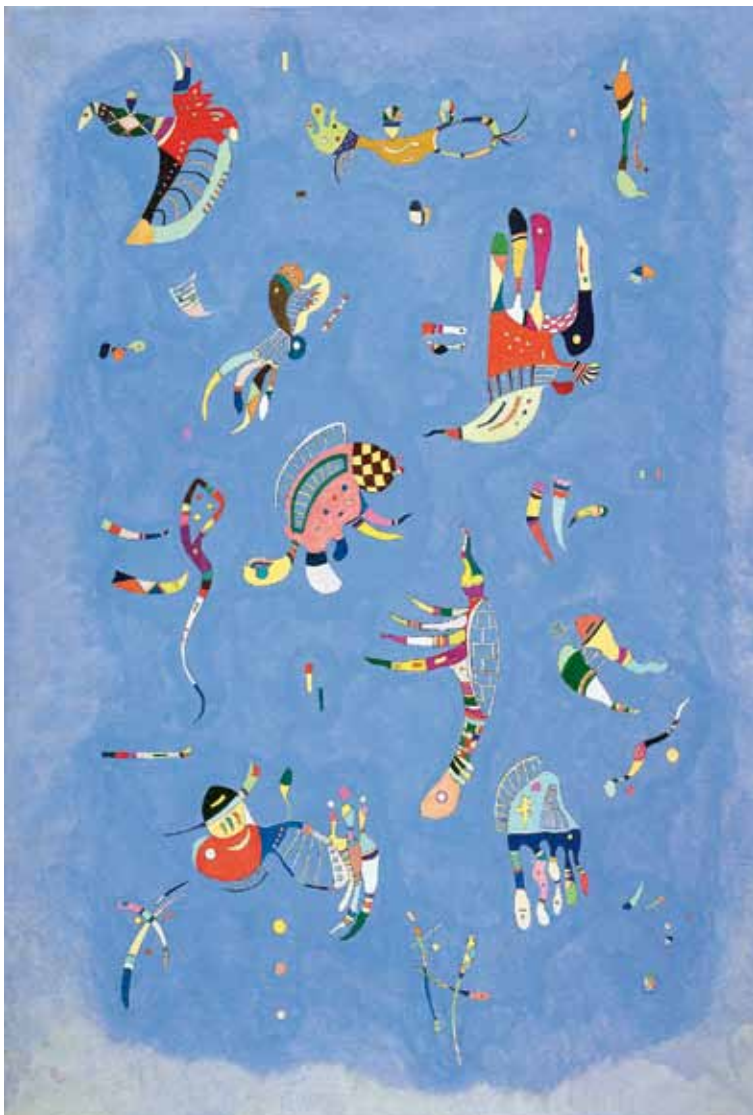
Vassily Kandinsky Bleu de ciel , 1940 Parigi, Centro Pompidou